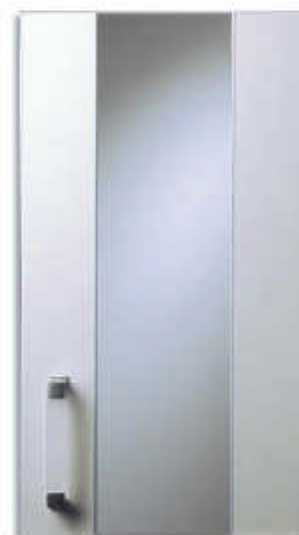
Verre gris avec 2 montants identiques à la façade