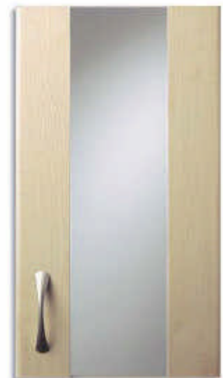
Verre gris avec 2 montants identiques à la façade.